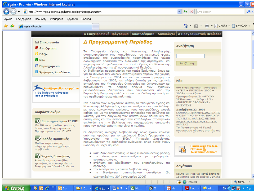
Εικόνα 4: Ιστότοπος Ειδικής Υπηρεσίας

Επικοινωνία του προγραμματισμού σε ενέργειες του Έργου ΕΠΙΟΝΗ «Προσδιορισμός επικοινωνιακής στρατηγικής και εφαρμογή επικοινωνιακού Σχεδίου Δράσης του Επιχειρησιακού Προγράμματος ΥΓΕΙΑ-ΠΡΟΝΟΙΑ 2000-2006». Σε 4 από τις ενέργειες του Σχεδίου Δράσης επικοινωνίας του ΕΠ ΥΓΕΙΑ-ΠΡΟΝΟΙΑ συμπεριληφθεί υλικό και μηνύματα του προγραμματισμού του τομέα για την Δ' Προγραμματική Περίοδο.