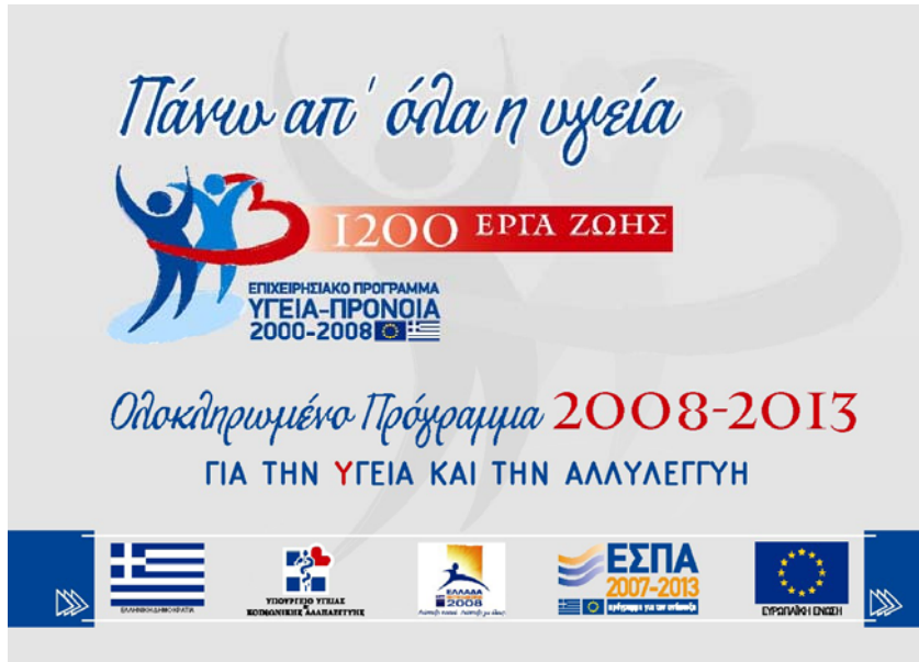
Εικόνα 2: Λογότυπα