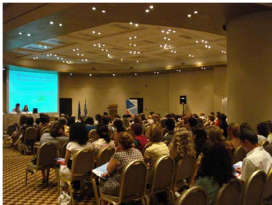
Εικόνα 3: Ημερίδα Ενημέρωσης Δικαιούχων τομέα Υγείας για την Πιστοποίηση